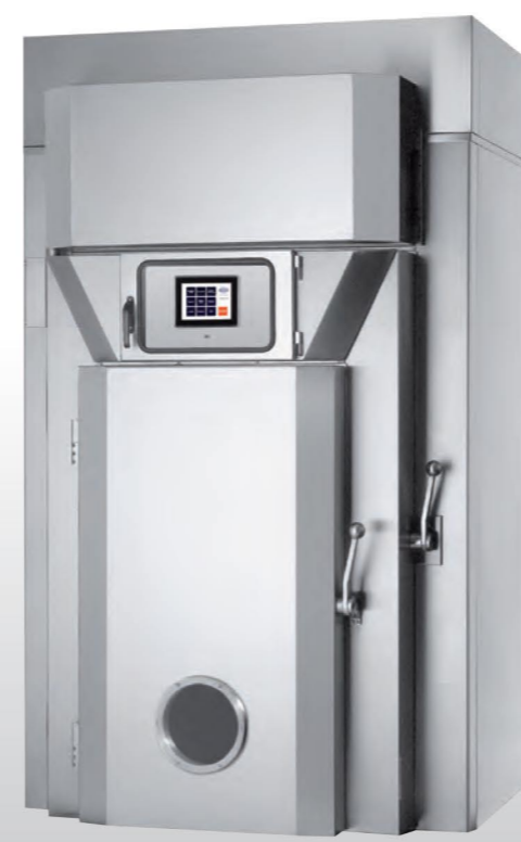
■ Gamme B 1500 Hublot en option