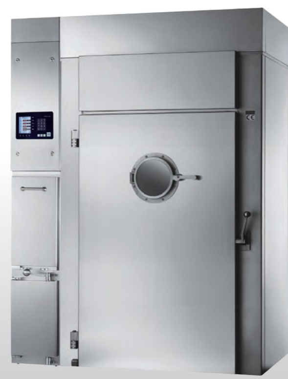
■ Gamme B 1200 Hublot en option