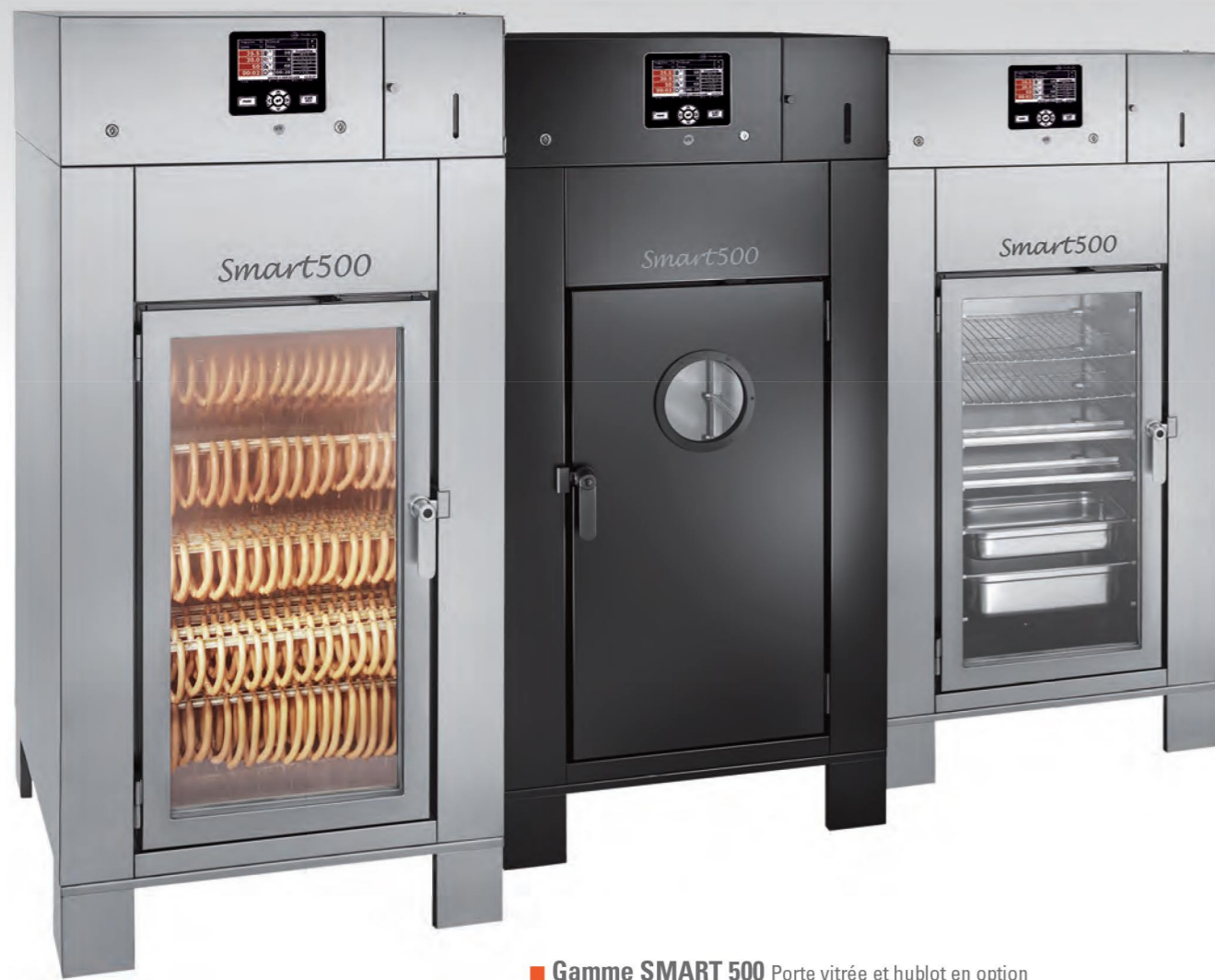
■ Gamme SMART 500 Porte vitrée et hublot en option