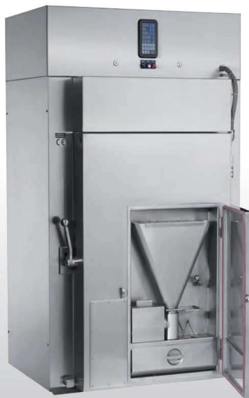
■ Gamme B 850 Porte vitrée en option