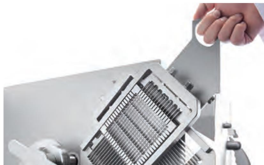
■ Changement de grille en 10 secondes