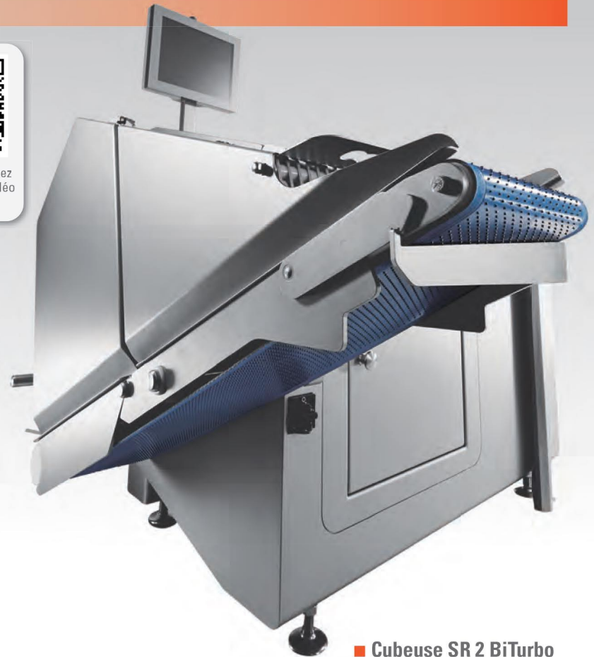
■ Cubeuse SR 2 BiTurbo