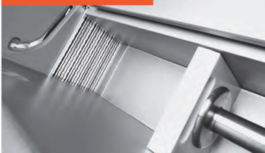
■ Pré-compression latérale, finement dosée