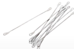
■ Couteaux à fromage