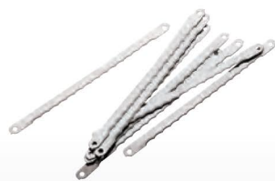
■ Lames ondulées