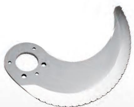
■ Couteau à découper les os