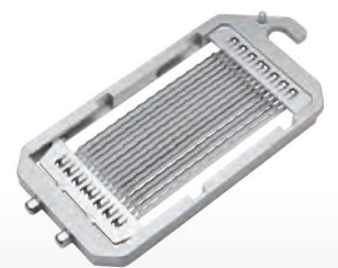
■ Niveau de grille SR 1