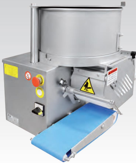
■ Formeuse à steaks F 1000