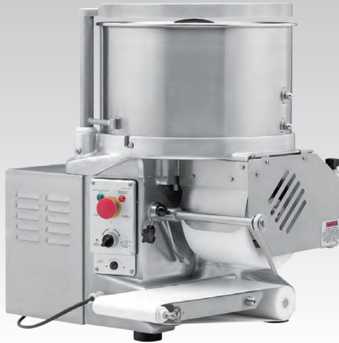
■ Formeuse à steaks F 2000