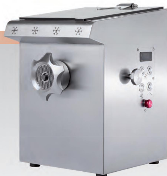
■ Hachoir réfrigéré DRC R 98 / DRC R 32