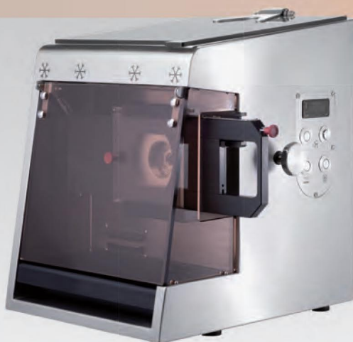
■ Hachoir réfrigéré vitrine DRC VR 82