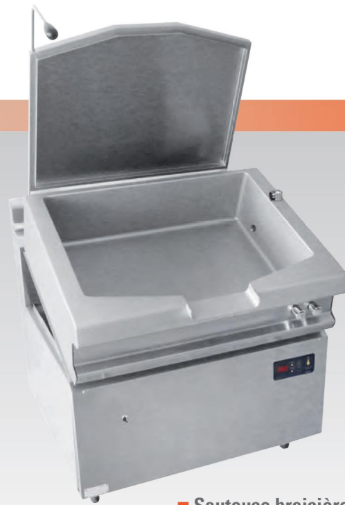
■ Sauteuse braisière avec fond bimétal épaisseur 12 mm