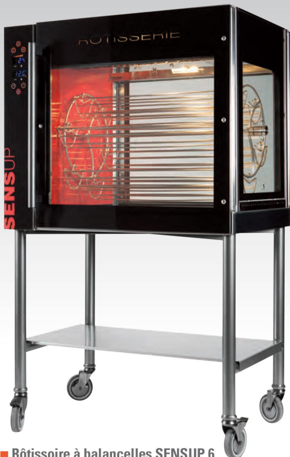
■ Rôtissoire à balancelles SENSUP 6