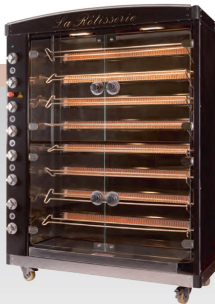
■ Rôtissoire à broches MAG 6