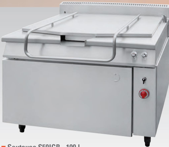
■ Sauteuse S50IGR - 100 l